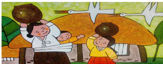
그림 13